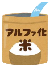
非常食アルファ化米 炊き出し体験

お子様だけのご来場は ごえんりょください。 かならず18歳以上の おとなと来てくださいね。